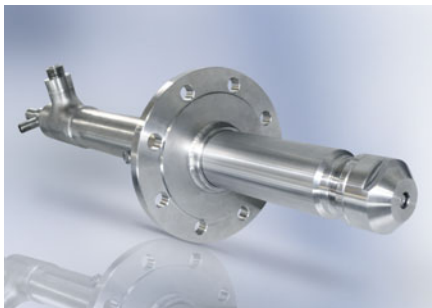
SCHLICK-Zweistoffdüse mit externer Mischung und Kühlmantel um die Flüssigkeit

Bei außenmischenden Systemen werden Flüssigkeit und Zerstäubungsmedium – meist Dampf – kurz nach dem Verlassen der Stirnseite intensiv durchmischt. Der Austrittskegel der Zweistoffdüse beträgt etwa 30 bis 40°.