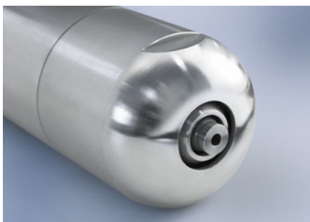
Frontbereich einer SCHLICK-Dreistofflanze

Es besteht zudem die Möglichkeit einen Kanal zusätzlich mit Luft, Gas oder Dampf zu beaufschlagen, und so eine größere Austauschfläche zwischen Zerstäubungsmedium und Flüssigkeit zu schaffen.