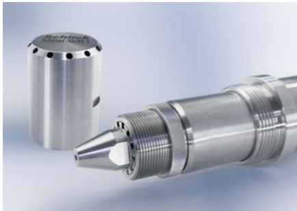
SCHLICK-Zweistoffdüse mit interner Mischung Patentierter SCHLICK-Innenmischkappe

Ein Kegel in der Mischkammer bewirkt das Verteilen des zentral auf die Kegelspitze treffenden Flüssigkeitsstrahles zu einem Film, der von der gedrahten Zerstäubungsluft in Tropfen zerrissen wird.