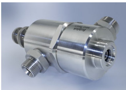
SCHLICK-Zweistoffdüse mit Flüssigkeitsregulirnadel

Das Leistungsspektrum von Zweistoffdüsen mit externer Mischung liegt zwischen 1 bis 2000 kg/h. Sicherlich nimmt bei zunehmender Durchsatzmenge die Zerstäubungsqualität der Düse ab. Trotz allem sind hier durch entsprechende Maßnahmen mit Hilfe der Vorzerstäubung Tropfengrößen von weniger als 200 µm möglich. Optional sind die Aggregate auch mit Flüssigkeitsregulirnadel bei großen Durchsatzschwankungen möglich.