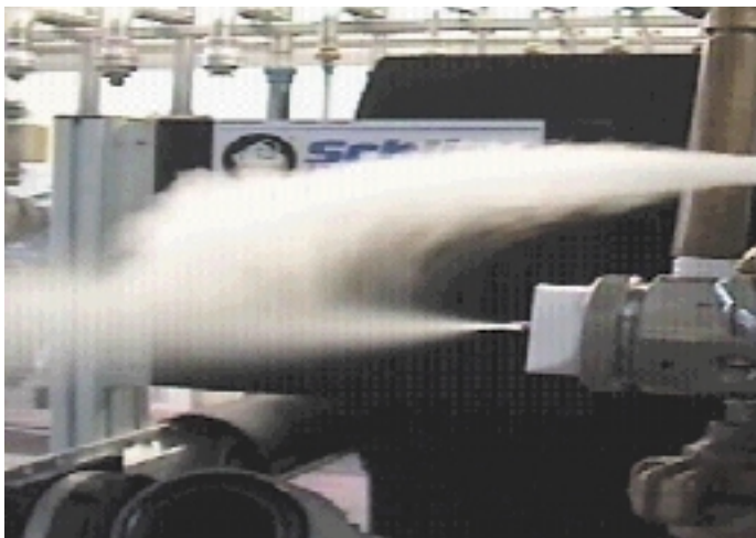
Bild 2: Staubpartikel werden von der neuen Luftkappe ferngehalten, anstatt an ihr anzuhaften

• Größenverhältnis Seitenluftbohrung/ Mittelbohrung sowie • Abstände der Bohrungen etc. optimiert. Die neue Kappe kann aus verschiedenen Werkstoffen – in erster Linie Edelstahl und Kunststoff – hergestellt werden. In vergleichenden Worsen-Case-Untersuchungen zwischen einer herkömmlichen Luftkappe und der neuen Anti-Bearding-Cap wurden extreme Aufbauten und Bartbildungen an der Standard-Kappe erzeugt, jedoch in keinem Fall an der neuen Kappe (Bild 1). Die Einlasstemperatur am Coater betrug 75 °C, die Auslasstemperatur 50 °C, der Durchsatz der Coater-Luft rund 850 m 3 bei 600 mm Durchmesser der Coater-Trommel. Pro Düse wurden 100 g/min „Opadry pink“ in 16%-iger Konzentration verarbeitet. Nach einer Sprühdauer von lediglich 45 min war die Standardkappe dermaßen verstopft, dass nur noch grobe Tropfen erzeugt werden konnten. Im Strömungsbild (Bild 2) ist unschwer zu erkennen, dass durch die Neukonstruktion die umströmenden Staubpartikel, die in der Praxis zwangsläufig im Umfeld der Düse zirkulieren, viel besser von der neuen Luftkappe fern gehalten werden, anstatt an der Luftkappe anzuhaften.